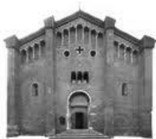
PARROCCHIA DI SAN TEODORO