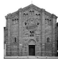
PARROCCHIA SANTA MARIA IN BETLEM

Come ormai la tradizione vuole anche quest'anno, in occasione della 23 a Santa Messa sul fiume, grazie alla disponibilità delle parrocchie di San Teodoro e Borgo Ticino, la collaborazione dei sodalizi remieri, nonché degli imbarcaderi del Ticino, abbiamo pensato di rendere onore a San Teodoro, patrono dei barcaioli e della gente del fiume.